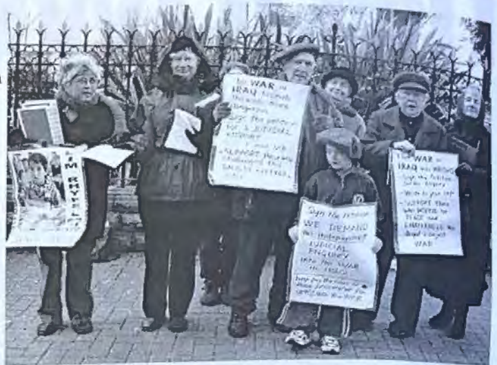
Caerdydd Chwefror 2004: Ymateb i Hutton I - ymchwil cyhoeddus

Mae hi'n bron i 35 mlynedd ers i'r Cytundeb Gwrth-Ymlediad (NPT) ddod i rym ym 1970, ac mae 189 o wladwriaethau bellach wedi cytuno i'w fwiad o ddiddymu arfau niwclear. Er gwaethaf hyn rydym mewn sefyllfa ar hyn o bryd lle mae'r Unol Daleithiau yn fodlon lawnsio rhag-ymosodiad gan ddefnyddio arfau niwclear, Prydain yn gwrthod diystyru defnyddio arfau niwclear yn Irac, mae ymchwil a datblygiad a phrofi arfau niwclear yn parhau, mae arfau niwclear o hyd yn cael eu hystyried fel rhan annatod o gynllunio NATO a lle mae cenhedlaeth newydd o arfau niwclear maes y gad yn cael eu datblygu a niwcliareiddio'r gofod ar ei ffordd.